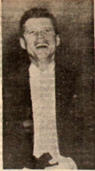
Başkan Kennedy Kim vurduya gitti.

Bu arada Amerika, yeni Kıbrıs planları hazırlamaktadır. Enosis'e karşılık Türkiye'ye bazı tavizler verme esasına dayanan bu planlar, Atina tarafından desteklenmektedir. Türk Hükümeti de yeterli taviz karşılığı Enosisi kabul etme razı gibidir. Amerikan planlarına mukavemet, Türkiye'ye taviz vermiyen bir çözüm isteyen Makarios'tan gelmektedir. Makarios, Adadaki bir karış toprak üzerinde dahi olsa