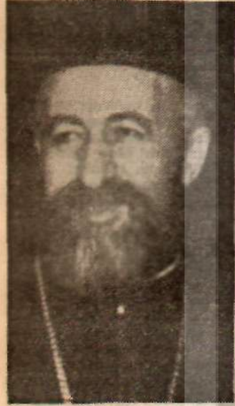
Makarios Enosis'e itirazlı.

Rapor sayesinde, Amerikan halkının tehlikeli heyecanlara kapılması önlenmiş, toplumun gerçeklere göz yumma pahasına huzur içinde uyuması sağlanmıştır. Ama uyanık çevrelerde, Kennedy'nin geriklerini bir komplo suna kurban gittiği inancı, Warren raporundan sonra daha da kuvvet kazanmıştır.