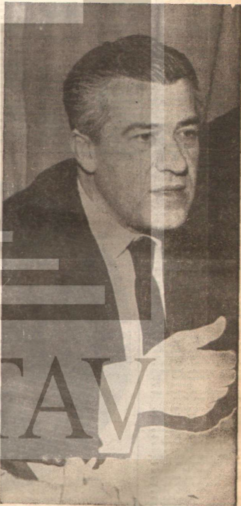
DR. KEMAL SATIR