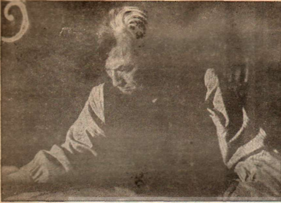
Gregory Peck, beyazperdede Kaptan Ahab rolünde